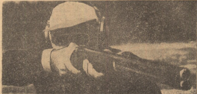
Ștefan Popovici — din nou campion balcanic la talere lansate din sașă. Cititi amănunțit în pagina a IV-a

Intr-adevăr, la campionatele europene al căror start se va da astăzi, s-au înscris un număr foarte mare de tînțași: 150, din 24 de