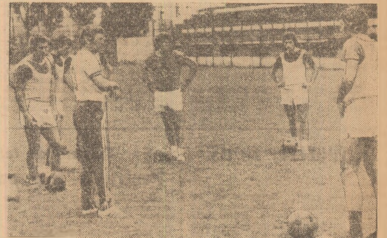
Antrenorul Motroc și cîțiva dintre elevii lui, înaintea antrenamentului de ieri.