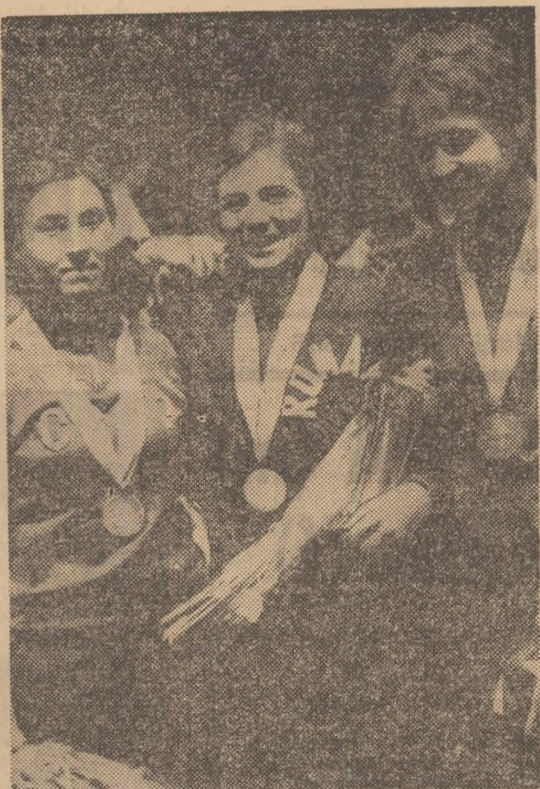
Budapesta