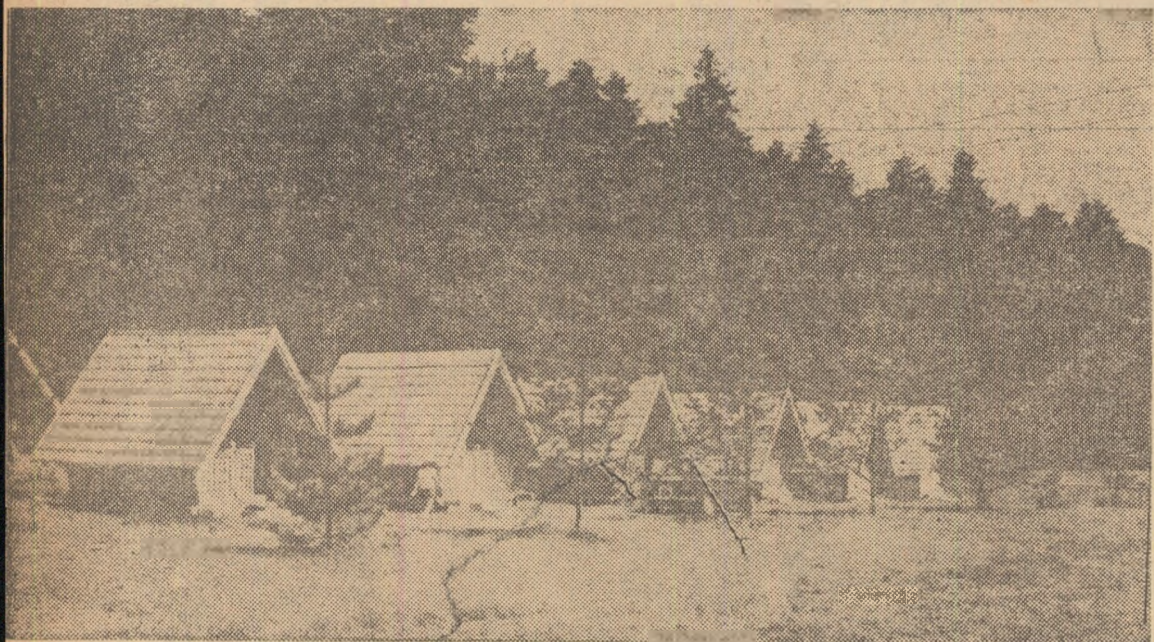
În preajma fagilor, micile „căsuțe” din lemn...

„Feciorii lui Bachus” ș.a. O surpriză: „Popasul Timboiești” (jud. Vrancea) — 8 căsuțe din zid, purtînd fiecare, pentru a fi distinse, nume de flori — aparținînd cooperativei agricole de producție din comuna Timboiești. Cooperatorii, vîzînd că prin partea locu-