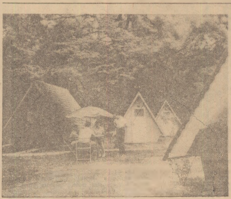
Cadru natural ideal, confort, liniște... La campingul „Românești”, turiștii se destînd la umbra copacilor falnici

În finala turneului internațional de fotbal desfășurat în localitatea spaniolă La Linea s-a întîlnit formațiile Espanol Barcelona și Steaua București. Fotbaliștii spanioli au obținut victoria cu scorul de 2-0, prin golu-