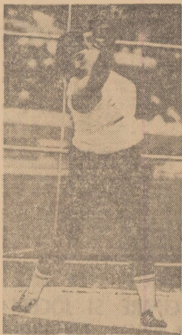
Argentina Menis a avut ieri o comportare excelentă, la nivelul cel mai ridicat demonstrat vreodată de ea.