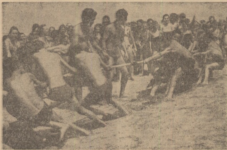
Fortă, dărzenie, voință — de o parte și de alta a frînghiei!