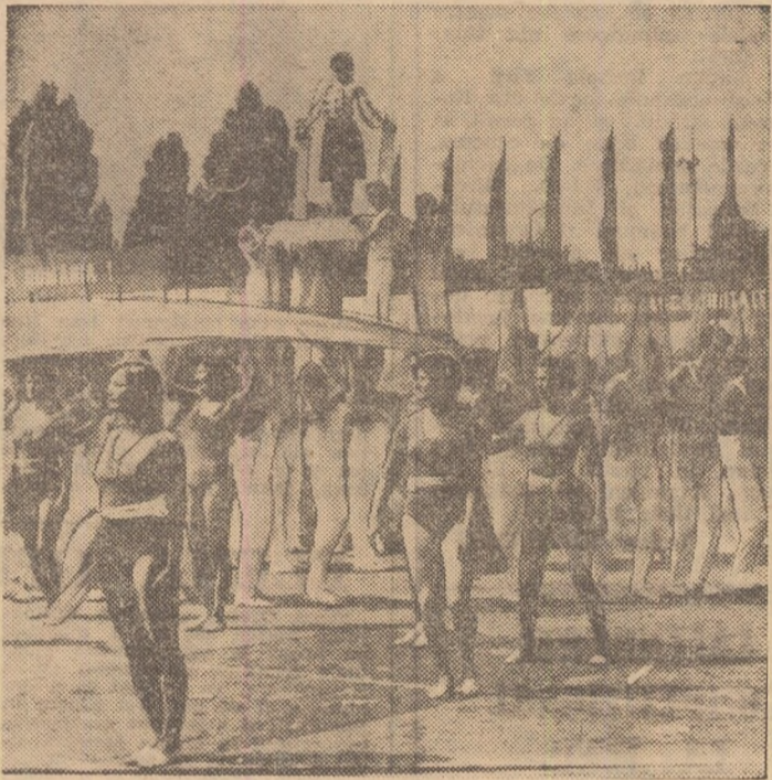
„Citius, altius, fortius“, cunoscutul dicton al autodepășirii ome- nești, pare să-l sugereze această piramidă vie a studenților de la I.E.F.S.