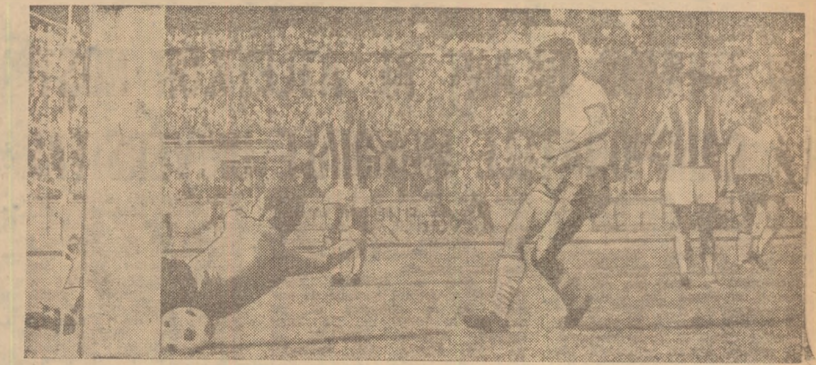
Tevi (în tricou alb) a sutat pe sub portarul Cojocaru și a mărit la trei goluri, avantajul echipei Progresul (Fază din meciul Progresul București - Autobuzul București).

BRAȘOV, 21 (prin telefon). Peste 10.000 de spectatori au tinut să