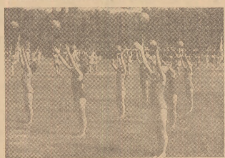
Ansamblul de gimnastică modernă a smuls ropote de aplauze pentru frumoasa execuție a tinerelor sportive.