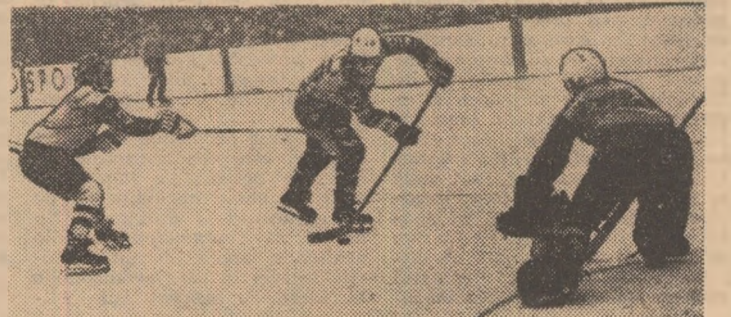
Întă finalizarea celui mai frumos gol al meciului: Pană, pornit din propria treime, a driblat patru adversari (ultimul este Ioniță), înscriind

Seară plăcută, marți, la patinoarul „23 August”! Un public numeros, două partide echilibrate și abundente în faze de mare spectacol, surprinzătoare răsturnări de situații. Ar trebui — în plus — cuprinsă în acest succint bilanț și satisfacția generală a unui remarcabil progres în joc sensibil pe toate planurile: nivel tehnic și tactic, angajament fizic, organizare, arbitraj.