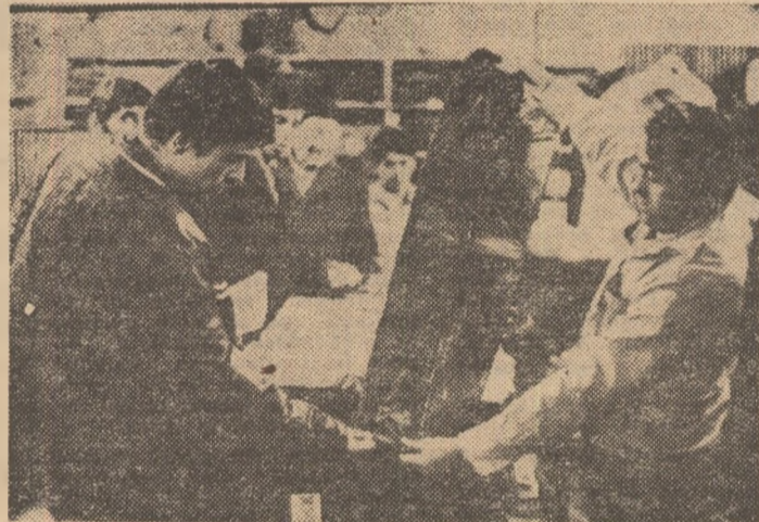
La magazinul „Olimpic“ din Capitală: noul tip de costum de schi, din fibre sintetice, captează interesul cumpărătorilor

„În drum spre „SORA“, situat în alt punct cardinal al orașului, ne îmbie din vitrinele frumoase ornate ale magazinelor „Sportivilor“ și „Caba-na“, de la gută pentru undite pînă la corturi confortabile, tot ce-și poate dori un îndrăgostit de mișcare fizică. „Pionier“ și „Acroplan“, sînt cuvinte care