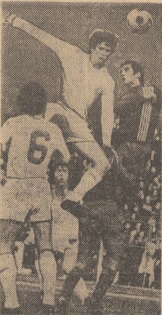
Golgeterul Dudu Georgescu se înalță în stilul său caracteristic, rotind însă lovitura cu capul. (Fază din meciul Dinamo — Politehnica Iași, 2-0).

mațiilor noastre, oficial recunoscute ca fiind de prima categorie, sînt încă departe.