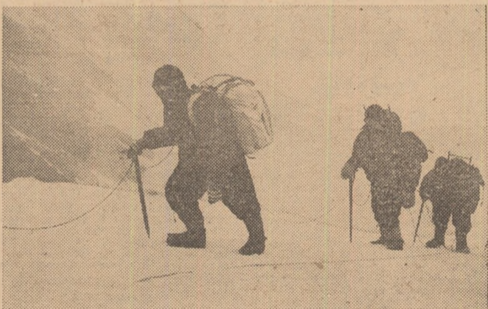
Pan To, în drum spre tabăra de la 8200 m

În acest „An internațional al femeii” poate nu întîmplător s-au înregistrat numeroase performanțe mondiale deosebite realizate de sportive. Printre