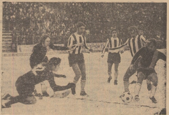
Acțiune de atac a ceferiștilor clujeni la poarta lui Stan, rămasă fără rezultat. Fază din partida C.F.R. — Politehnica Iași.