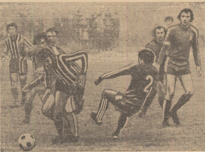
Aglomerație în preajma careului. Atacantii se strecoară tot mai greu spre poartă. Iată o asemenea fază din meciul Voința București — Automatica Alexandria (1-0)

Merită a reliefa, acum la jumătatea întrecerii, comportarea în general bună a unor formații ca Prahova Ploiești, C.S.U. Galați, F. C. Petrolul Ploiești (seria I), Dinamo Slatina, Steagul roșu Brașov, Electroputere Craiova (seria a II-a), F. C. Șoimii Sibiu, Minerul Moldova Nouă și Victoria Călan (seria a III-a). De fapt, acestea, împreună cu echipele de care am amintit mai sus, formează plutoanele frunțate din cele trei serii ale eșalonului secund.