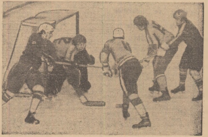
Aspect de la unul din ultimele antrenamente ale lotului nostru de juniori.