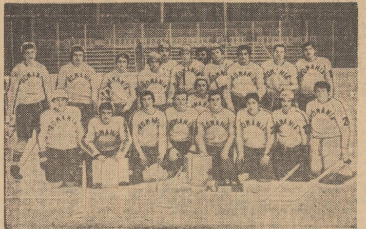
Echipa de juniori a României cîștigătoare „Turneului celor 6 națiuni” la hochei