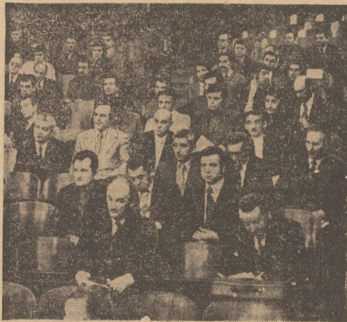
Aspect din sala care a găzduit consfătuirea antrenorilor divizionari de fotbal

A luat, apoi, cuvîntul, tov. Ștefan Covaci, vicepreședintele al F.R.F. și antrenor al echipelor naționale, care a enumerat o serie de factori fără ameliorarea cărora nu se va putea realiza o creștere a valorii fotbalului nostru. Este vorba de: moralitatea, echitatea și cinstea care trebuie să se instaureze în activitatea fotbalistică; eliminarea birocratismului, care grezează munca antrenorilor; eliminarea intervenționismului sub orice formă din viața fotbalului; perfecționarea și îmbogățirea sectorului organizatoric (terenuri, instalații, etc.); creșterea ambiției, a emulației noii generații de antrenori și aplicarea unor insistente metode de neînclătă perfecționare a acestor