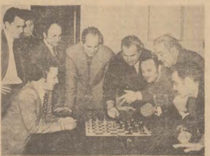
Înainte plecării la Montana-Crans, lotul jucătorilor români își studiază... viitorii adversari