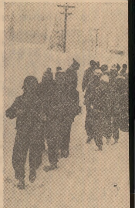
Jucătorii lui F. C. Bihor aleargă prin meții stațiunii Stina de Vale

stațiunea Stina de Vale. Pe o zăpadă care a atins, la un moment dat, grosimi-record, cei 29 de jucători (la primul lot a fost adăugat un pluton de opt componente ai lotului de tineret-speranțe) au lucrat cu multă trageră de inimă, într-o atmosferă de bun moral, la înmaga-