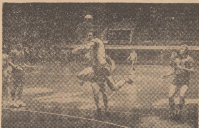
Contraatac al dinamoviștilor brașoveni finalizat de Schmidt.