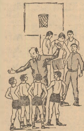
Nu uitați ce v-am învățat, recuperați totul sub panou!