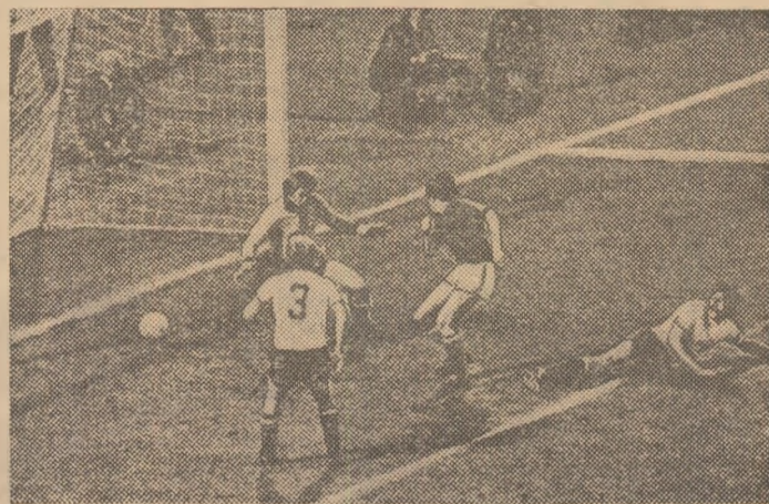
Fază din meciul Ungaria — Austria (2-1), din cadrul campionatului european, desfășurat la 24 septembrie 1975, la Budapesta. În imagine, Pusztai (în tricou de culoare închisă), înscris golul victoriei

GRUPA 4: Se prevede o luptă pasionantă între echipele Belgiei