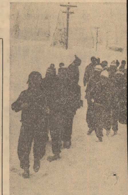
Jucătorii lui F. C. Bihor aleargă prin meții stațiunii Stina de Vale.

stațiunea Stina de Vale. Pe o zăpadă care a atins, la un moment dat, grosimi-record, cei 29 de jucători (laprimul lot a fost adăugat un pluton de opt componenți ai lotului de tineret-speranțe) au lucrat cu multă trageră de inimă, într-o atmosferă de bun moral, la imagina-