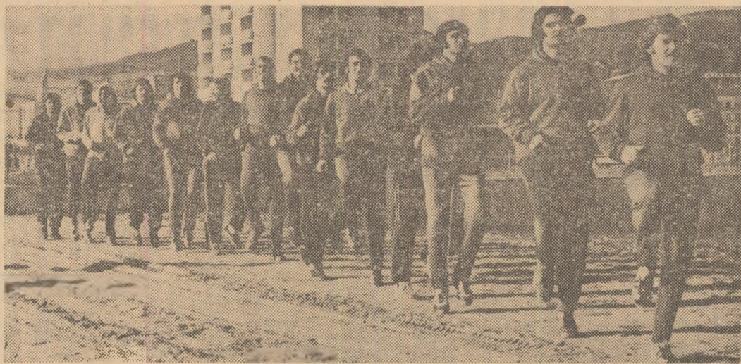
Pornit din fața hotelului, plutonul Jiului se va... răsfiira încet, încet spre marșurile Orșovei, pentru a străbate traseele stabilite de antrenorul Ion Ionescu