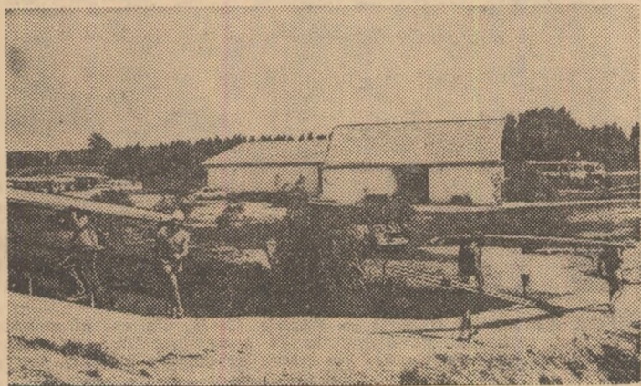
— A fost odată...

scriptică. De fapt, nu tocmai scriptică, pentru că în cursul sezonului 1975 a consumat 32000 lei, sumă ce nu poate fi trecută la vederea, mai ales că pentru justificarea ei nu există nici un fel de rezultat.