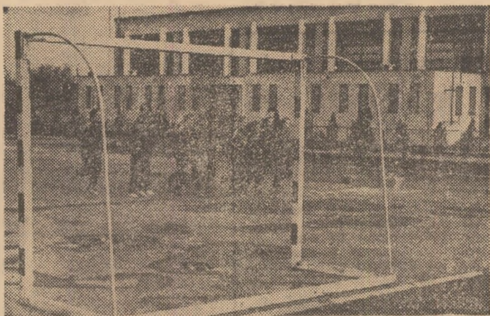
La Școala generală nr. 190 activitățile sportive se desfășoară pe noua bază și în sala recent date în folosință.