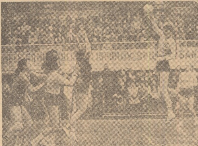
Fază din partida I.E.F.S. — Rulmentul Brașov, desfășurată în cadrul turneului de la București.