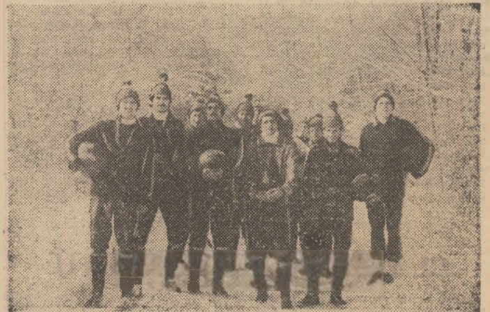
Lotul rapidist, înaintea startului în greaua cursă de 9 km...

spre poartă, cu capul sau cu piciorul. „Medicinalele” erau — în timpul exercitiului în permanență la purtători. Sorinturi grele, chinuitoare... Nimeni nu cerea, deocamdată, precizie, ci ducerea la bun sfîrșit a acțiunii.