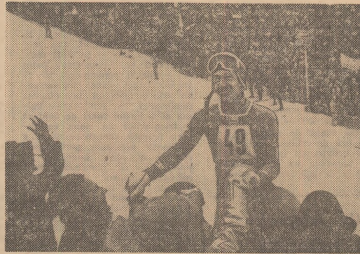
Zeci de mii de spectatori au aplaudat cu entuziasm succesul austriacului Karl Schnabl în ultima probă a J.O., săriturile de la trambulină.

Într-un clasament al tuturor Olimpiadelor de iarnă, inaugurate în anul 1924 la Chamonix, pe primul loc s-ar afla echipa Norvegiei, cu un total de 144 medalii, dintre care 50 de aur. Pe locul 2 — U.R.S.S. cu 118 medalii, dintre care 51 de aur (U.R.S.S. participă la J.O. de iarnă numai din 1952), pe locul 3 — S.U.A. cu 94 medalii, dintre care 30 de aur. Numai 24 de țări figurează în acest clasament al medaliilor, printre care și România, care a obținut o medalie de bronz, în 1968, la concursul de bob