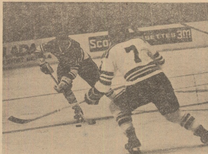
Unul dintre cei mai buni jucători sovietici, evidențiat și în cadrul J.O. de la Innsbruck, Aleksandr Jakusev în plină acțiune.

Cu ocazia J.O. de la Innsbruck, hocheiștii sovietici s-au dovedit iarăși cei mai buni! Câștigînd joc după joc, în aceeași manieră sobră și eficientă, rezultantă a unui hochei modern, bazat pe o excelență tehnică a patinajului și a mînării crosei, jucătorii din selecționata Uniunii Sovietice au cucerit în cele din urmă medalile de aur, realizînd această performanță pentru a 5-a oară consecutiv!