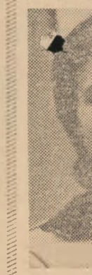
La recent campionat de baschet de la Ileana Gu

să facă, as sport, ci sū-natural din n-a omis f salcim. Și r nica aplicate lor se află tate.