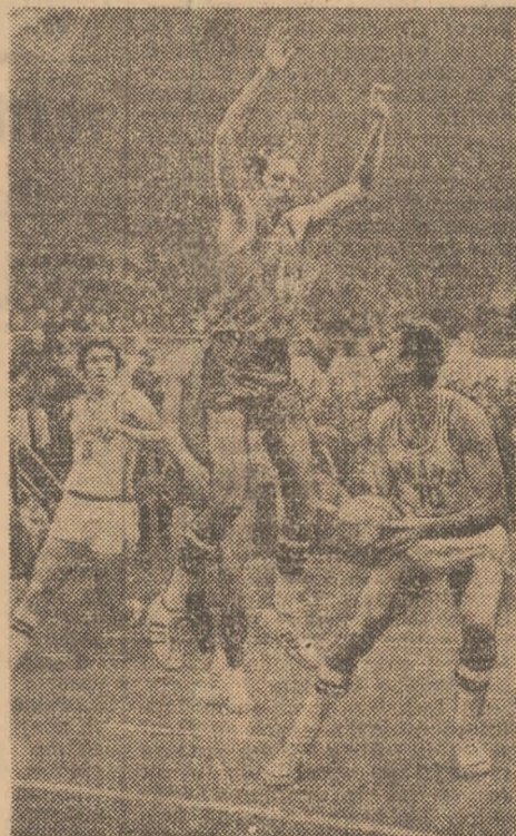
Imagine din cursul ultimului meci Steaua — Dinamo.

În deschidere, de la ora 16, au loc meciurile A.S.A. — C.S.U. Brașov. În ambele zile, reprizele secunde ale partidelor Steaua — Dinamo vor fi transmise la T.V.