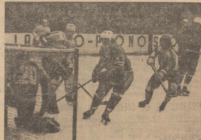
Atac al hocheiștilor români la poarta iugoslavă în partida finală a campionatului european de juniori grupa B