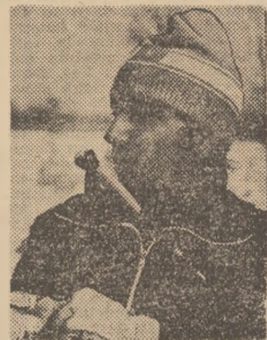
la Siktivkar, la 23 iulie 1953, are 1,74 m și cântărește 72 kg. Necăsătorit, practică schiul de 9 ani și este antrenat de Anatoli Akentiev.