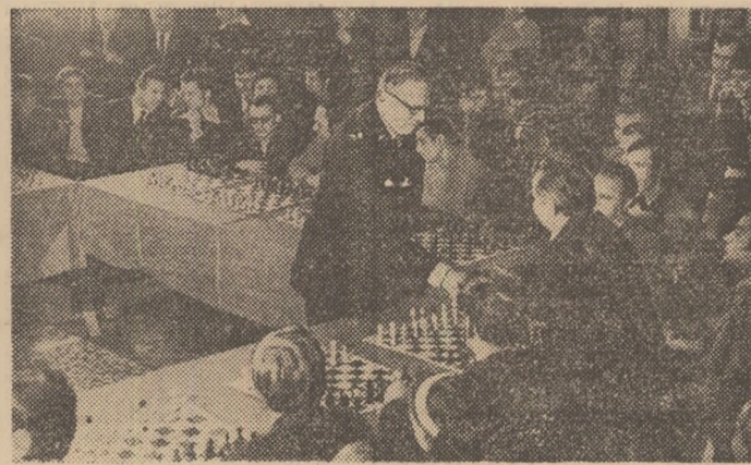
Aspect de la simulatul dat de dr. Max Euwe la Uzinele centrale de reparații I.T.B., în după amiaza zilei de marți.

— Aceasta ar fi cam mult spus. Într-adevăr, au fost luate în considerare doleanțele prezentate de Fischer în acel moment de impas, destul de regretabil, care a dus la retrage-