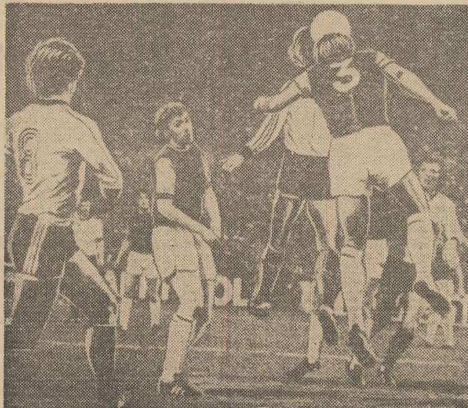
Moment din disputata partidă Eintracht Frankfurt — West Ham United (din Cupa cupelor) cîștigată la limită de formația vest-germană (2-1).

Agitatul sezon fotbalistic internațional continuă să presare cu scoruri surprinzătoare bilanțurilor marilor competiții. Echipa reprezentativă care își continuă căderea, în multe cazuri manifestată îndată după Weltmeisterschaft, fără să găsească o soluție a crizei (vezi cazurile echipelor Italiei sau Poloniei); cluburi care nu mai pot să revină acolo unde au strălucit cîndva (situația formațiilor italiene, a lui Ajax sau Celtic Glasgow), deși se zbat din răspuțeri să pășească umbra rezultatelor mediocre. În contrast cu asemenea cazuri, găsim selecționate sau echipe de club care regăsesc drumul marilor performanțe sau — situații și mai fericite — nu coboară nici un moment din prim-planul performanțelor.