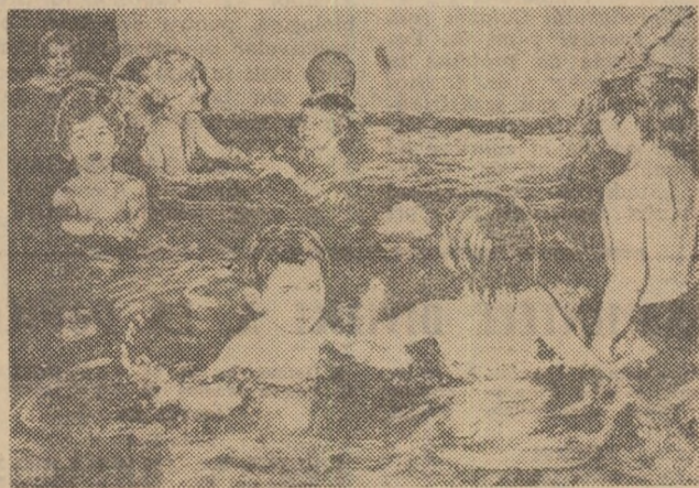
Copiii de vîrstă preșcolară învață inotul în piscinele din Ungaria.

pament. Asemenea săli sportive (dotate în majoritatea cazurilor cu săli de forță), situate în diferite cartiere, au fost numite în mod sugestiv: „Fortifică-te!” În timpul iernii, asemenea săli funcționează în centrul orașului, la demisolul clădirilor, unde cetățenii — indiferent de vîrstă — pot practica exerciții de gimnastică (ba chiar și gimnastică medicală), ridicări de haltere mici, adecvate cerințelor culturismului ș.a.