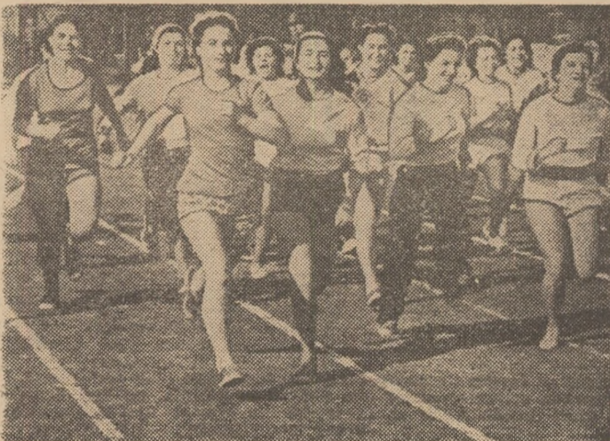
Tinere de la cooperativa „Ighena”, la startul întrecerii de cros.

La întreprinderea de utlaj chimic, ca și la întreprinderea de material rulant „Grivița Roșie” din București declanșarea primelor întreceri a fost precedată de o largă activitate de popularizare a programului acțiunilor, a pro-