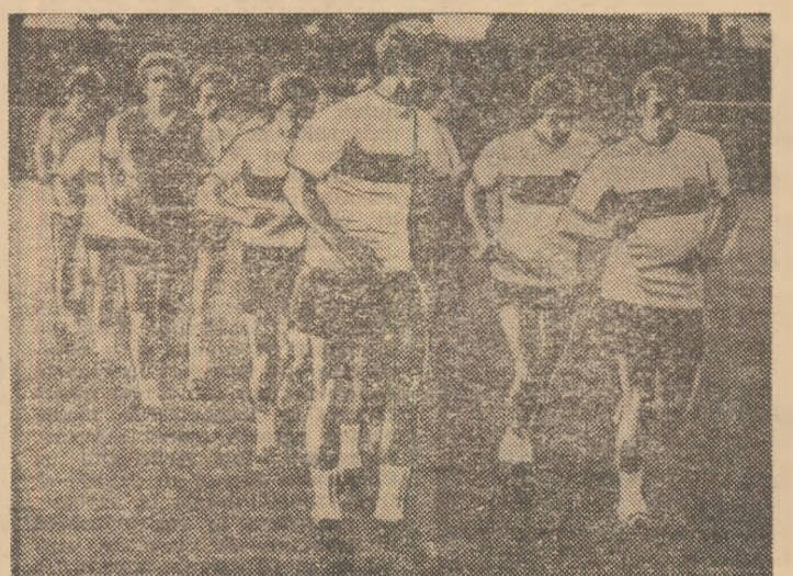
Aspect de la antrenamentul echipei Italiei inaintea plecării la turneul din S.U.A.