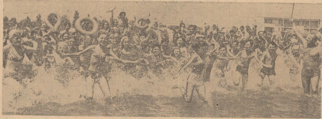
Vacanța de vară va însemna, și în acest an, o călătorie spre tărâmurile insorite ale litoralului, cu popas, pentru zeci de mii de școlari, la Năvodari, unde tabăra este pregătită să-și primească obișnuiții oaspeți...