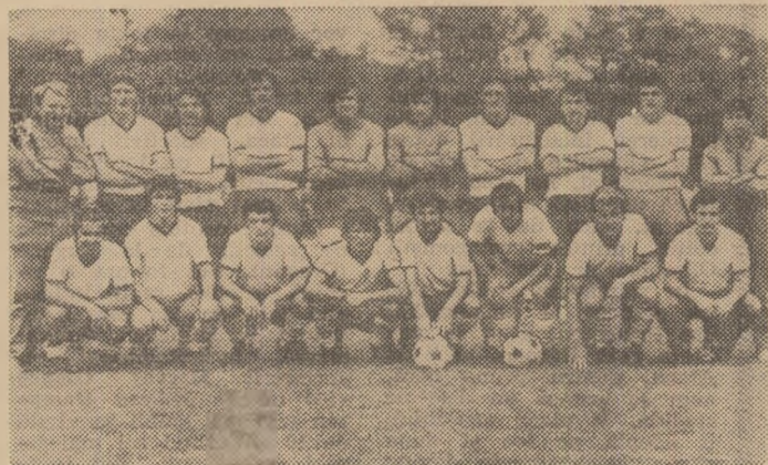
Progresul București, câștigătoarea seriei a II-a din Divizia B.