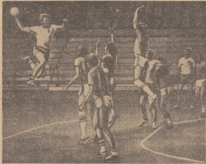
Aspect de la un prim antrenament al handbaliștilor români în compania echipei naționale canadiene, în sala Claude Robillard din Montreal