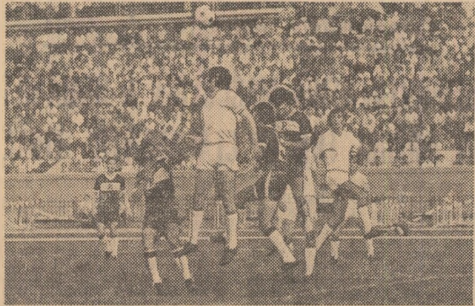
Două dintre promovatele ediției 1974-75, Rapid și S.C. Bacău, s-au întâlnit într-o vi disputată partidă în ultima etapă a campionatului. Iată o fază din acel meci.