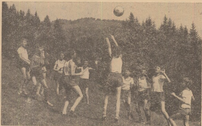
În aceste zile de vacanță, copiii petrec clipe minunate în taberele de la munte