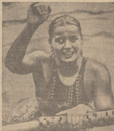
A sperat să realizeze un record absolut în maniera lui Mark Spitz și a vizat cinci medalii de aur. Chiar dacă pînă la urmă nu a obținut decît patru medalii de aur, Kornelia Ender, celebră inotătoare din R. D. Germană, a devenit fără îndoială vedeta nr. 1 a natației olimpice feminine la Montreal.

HOCHEI PE IARBA. Preliminarii — grupa A: Olanda — Canada 3-1 (0-1). Clasament: 1. Olanda 10 p (11-3); 2. Australia 6 p (14-6); 3. India 6 p (12-9); 4. Malaezia 4 p (3-7); 5. Canada 2 p (4-11); 6. Argentina 2 p (4-12); clasamentul grupel B: 1. Pakistan 7 p (16-6); 2. Spania 4 p (9-7); 3. Noua Zeelandă 4 p (6-8); 4. RFG 3 p (10-10); 5. Belgia 2 p (5-15).