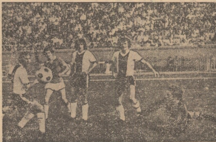
Secvență din meciul Rapid — Jiul (3—0): atac la poarta oaspeților, respins de Cavai. (Citiți cronică meciului în pag. 2—3)