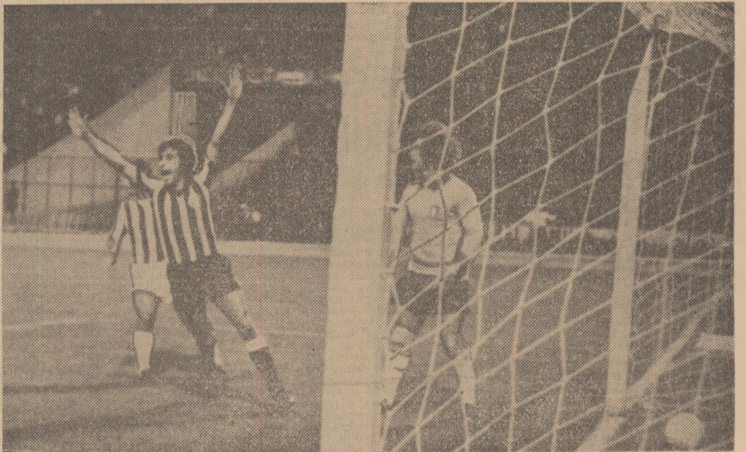
Momentul deschiderii scorului de către studenții bucureșteni în partida de aseară cu Olympiakos Pireu (rezultat final : 3—0)

Citiți în pag. 2—3 relatări de la aceste meciuri.