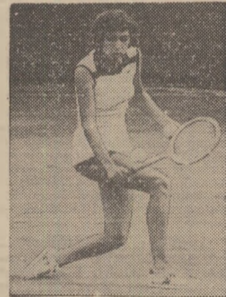
VIRGINIA RUZICI, din nou triplă campioană

a cărei autoare, din țara noastră campionă, dinamovină Virginia Ruzici. La 21 de ani abia împliniți, ea și-a completat palmaresul cu al 14-lea titlu republican, într-o specta-