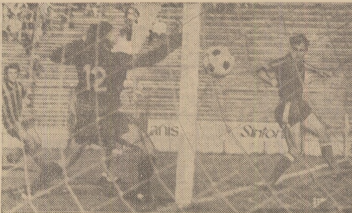
Așa a marcat Steaua al treilea gol: Vigu a reluat, de pe „linia de corner“, balonul, trimițîndu-l, printre Windt și stîlpul porții, în plasă.

Miercuri se dispută returul partidelor din primul tur al cupelor continentale la fotbal. Partea dintre cele cinci echipe ale noastre evoluează în deplasare (C.S.U. Galați, Dinamo, A.S.A. Tg. Mureș, Sportul studențesc), numai Steaua disputând partida-retur pe teren propriu. Iată ultimele știri legate de întîlnirile de miercuri. F. C. Bruges, adversara campioanei noastre, Steaua, sosește astăzi, cu avionul, la București, urmînd ca imediat să facă un prim antrenament. C.S.U. Galați a plecat ieri dimineață, cu avionul, pe ruta București-Paris-Porto, unde a sosit în cursul serii. Dinamo pleacă în această dimineață, pe calea aerului, la Milano. A.S.A. a părăsit ieri Bucureștiul, călătorind cu avionul pînă la Timișoara și, de acolo, pornește astăzi mai departe, cu autocarul, spre Zagreb. În fine, Sportul studențesc pleacă în această dimineață spre Atena, pe calea aerului.