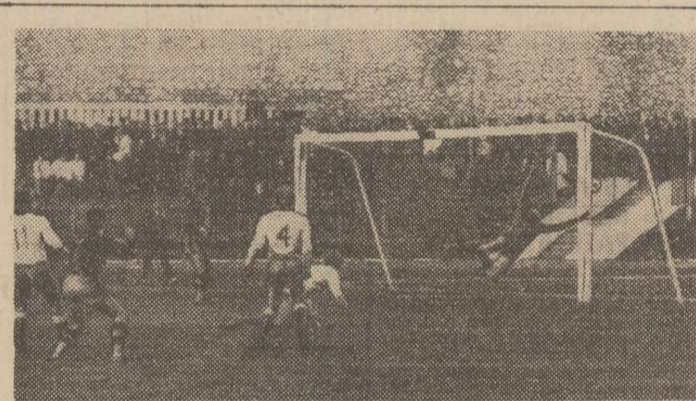
Așa s-a marcat unicul gol al meciului F.C.M. Reșița — Politehnica Timișoara: Atodresei (nr. 7) a șutat cu stîngul, făcînd inutilă intervenția portarului Catona.