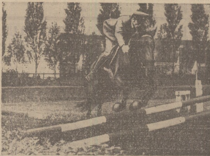
Ion Popa (Steaua) în timpul evoluției în cadrul campionatelor republicane, unul din călăreții cu o bună comportare