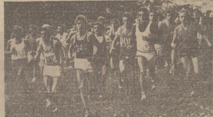
Duminică, la Craiova