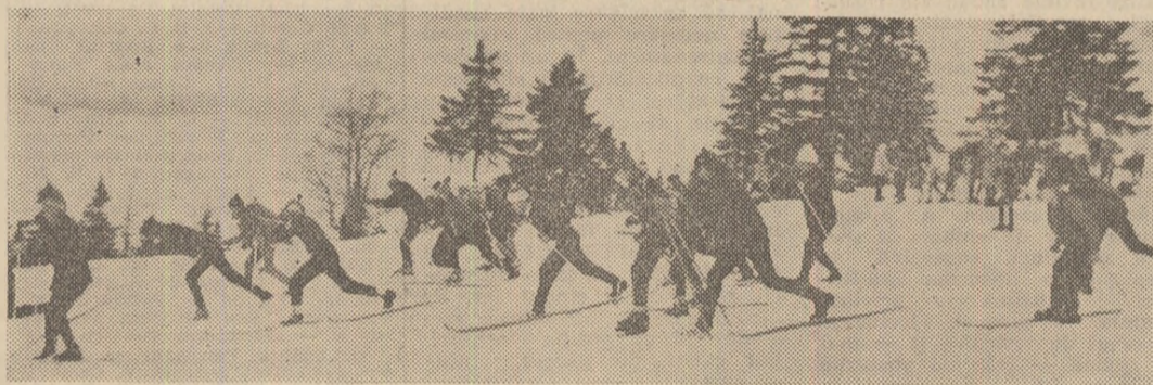
Primele semne mai convinșătoare ale sezonului hibernal și-au făcut apariția. Curînd programul activităților sportive de masă va cuprinde cu precădere acțiuni și competiții specifice, drumeții în zonele montane. O invitație la practicarea sporturilor de iarnă — prin această imagine surprinsă la Fintinele, în județul Bistrița-Năsăud.