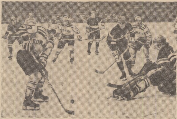
Din nou o ocazie ratată de echipa noastră: șutul lui Gheorghiu (în prim plan) a fost respins de portarul Marian Zbontar.