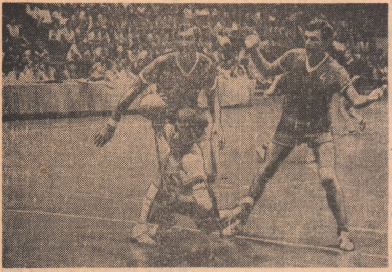
Fază din finala ediției trecute a C.M. universitar, disputată, în 1975, în țara noastră și câștigată de handbaliștii români, învingători în fața celor sovietici.

Echipa României, deținătoarea titlului, susține primul joc marți, în compania Japoniei