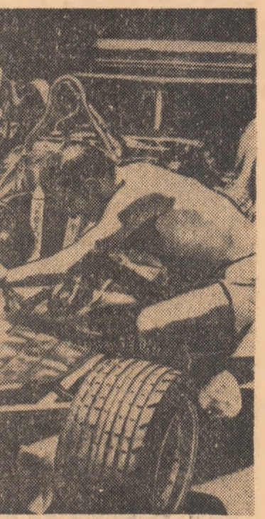
Mecanicii italieni ai echipei Ferrari pun la punct vehiculul cu care Niki Lauda va lua startul în Marele Premiu al Argentinei.

Participanții la „Marele Premiu” al Argentinei, probă inaugurată a campionatului mondial de automobilism rezervat piloților de formula 1, au efectuat pe circuitul din Buenos Aires primul antrenament oficial. Cel mai bun timp a fost realizat de francezul Patrick Depailler („Tyrell”), care a parcurs un tur de circuit (5,958 km) în 1:49,62. Rezultate bune au mai obținut irlandezul John Watson („Brabham”) — 1:50,49 și brazilianul Carlos Pace („Brabham”) — 1:50,98. Cunoscutul pilot austriac Niki Lauda („Ferrari”) a fost cronometrat în 1:51,14, în timp ce englezul James Hunt („McLaren”), deținătorul titlului mondial, a obținut al șaptelea timp al zilei — 1:51,74.