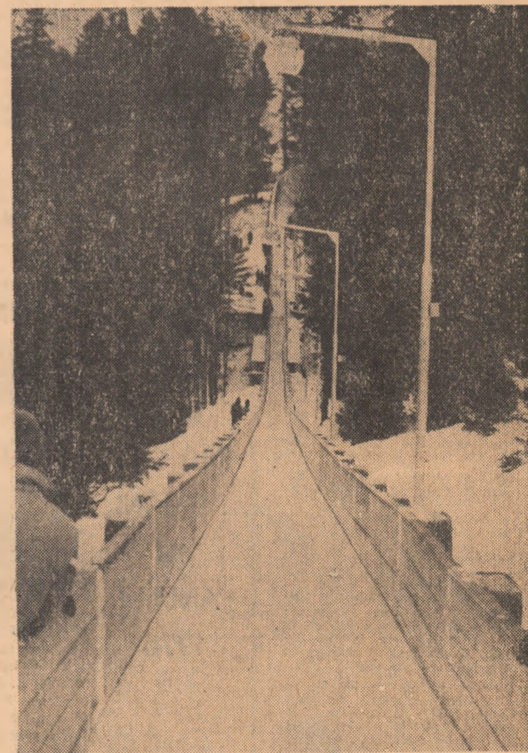
Linia dreaptă care încheie „cascada” de după virajul 13, una dintre cele mai spectaculoase porțiuni ale pîrtiei care va găzdui (într-o zi 27 februarie), campionatele europene de bob.

Este aproape sigur că înghețarea va fi gata la timp, atît pentru antrenamente, cît și pentru concursurile internaționale, dintre care primul - de sanie - este programat la sfîrșitul lunii. Creдем că se impune totuși o concentrare de forțe din partea constructorilor, cu o urmărire precisă și exactă a graficului de lucrări, aceasta constituind o garanție că anexele vor fi gata la vreme, cu un spațiu de timp necesar testărilor. Este ultimul ocaz - al 12-lea - și se impune măsuri grabnice, altfel întregul calendar competițional prevă-