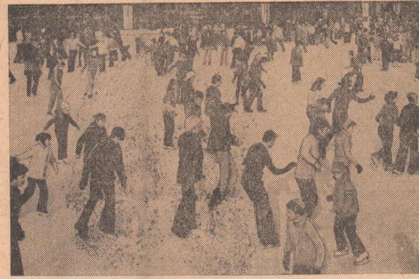
Foarte sollicitat, patinoarul artificial Floreasca din Capitală

Au trecut doar cîteva zile din noul an și sîntem în măsură să consemnăm cu multă satisfacție, că pretutindeni în țară s-au desfășurat, mai ales sîmbătă și duminică, ample acțiuni sportive de masă. Pe pîrtii sau patinoare, în săli de gimnastică, la cluburi, cămine culturale, mîi, zeci de mii de tineri s-au aflat laolaltă făcînd sport. Putem aprecia, bazîndu-ne pe relatările de la corespondenții noștri, că începutul în ceea ce privește activitatea sportivă de masă în 1977 este de bun augur. Iată și cîteva exemple :