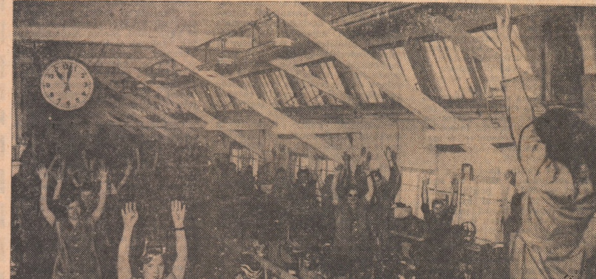
Deși fotoreporterul nu a rostit cunoscutul „zimbăi, vă rog”, gimnastica se face cu zimbetul pe buze, fiindcă place (imagine de la „Clujana”).