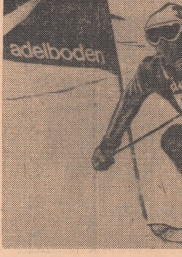
Datorită locului secund ocupat în slalomul uriaș de la Adelboden, suedezul Ingemar Stenmark este din nou liderul „Cupei Mondiale”

În concursul de patinaj viteză desfășurat la Davos (Elveția), canadiana Sylvia Burka a câștigat „multiatlonul”, cu un total de 178,825 p fiind urmată de Leah Poulos (S.U.A.) — 178,660 p. În competiția masculină, după trei probe, pe primul loc se află olandezul Jos Valentijn — 117,355 p, urmat de Peter Müller (S.U.A.) — 117,475 p. Concursul masculin nu s-a putut încheia, deoarece temperatura a urcat brusc, făcînd imposibilă disputarea ultimei probe. Rezultate tehnice: feminin: 500 m, Leah Poulos — 43,03; 1000 m — Sylvia Burka 1:27,33; masculin: 500 m — Valentijn 38,49