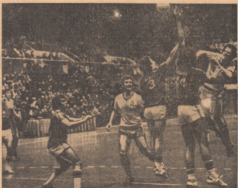
Radu Voinea nu reușește să tragă peste blocajul format din înalții interii Albizu și Novoa. Fază din meciul Steua — Calpisa Alicante (22-19)