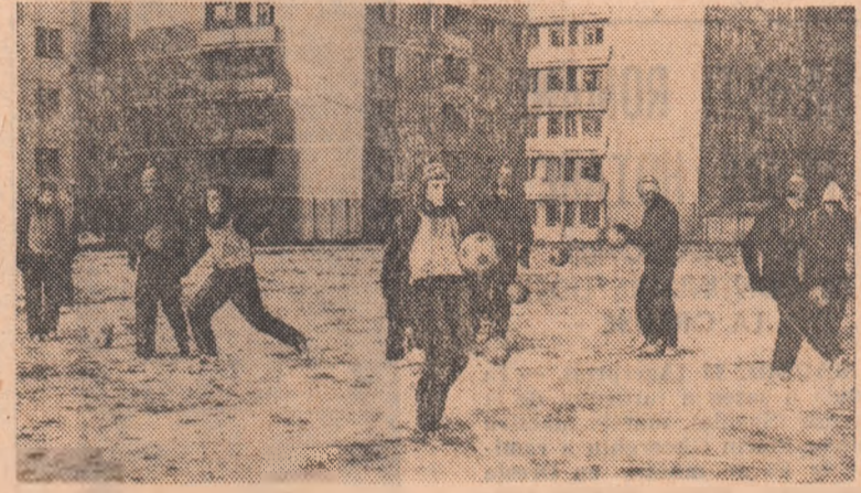
Moment de pregătire tehnică, pentru dezvoltarea simțului mingii, cu jucătorii de la Progresul.

unei mai bune interpretări colective a momentului defensiv. Aceasta, deoarece în prima jumătate a acestui campionat, Progresul a primit un număr de 32 de goluri (în medie, aproape două de meci), dintre care - potrivit aprecierii antrenorului D. Baboie - 10-12 ca o consecință a unor elementare greșeli de apărare. Cu nu mai puțină atenție este privită problema perfecționării jocului în ofensivă, alți în fafale dinamice, cit și în cele statice. Echipa de contraatac, Progresul beneficiază - ca urmare a inter-