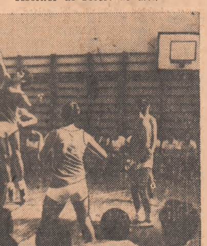
Una din competițiile de masă — întreceri interclase — la Liceul „Nicolae Bălcescu” din Capitală

evident în raport cu alte unități similare. Competițiile în circuit la jocuri sportive (fotbal, handbal, volei), întrecerile de tenis de masă și săh, precum și inițierea și organizarea unor iatreceri specifice sezonului (pe patinoarul natural propriu dat în folosință de curînd), iată o suită de activități, care atestă pasiunea și competența profesorilor de resort de aici.