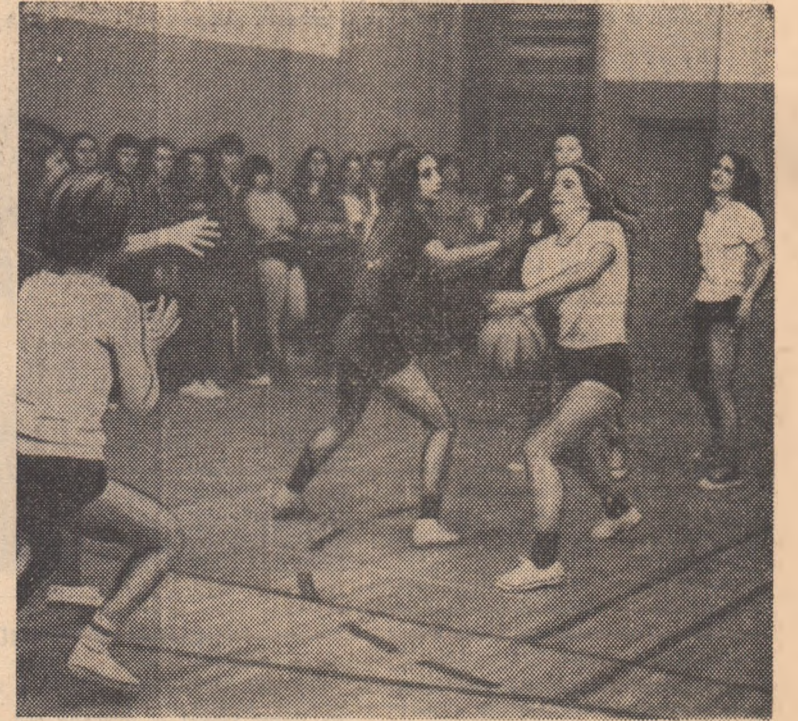
Ieri, în sala de sport de la A.S.E., meci de baschet în „Cupa Independenței”

La Academia de Studii Economice peste 10.000 de viitori economiști frecventează cursurile diferitelor facultăți. Despre eficiența sportului în rîndul studenților din