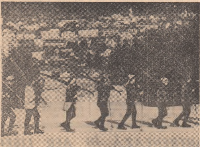
Spre start! Numeroși tineri iubitori ai sportului de pe meleagurile sudene se întinse la întrecerile de schi. Printre aceștia s-au numărat și finalele județene la schi fond și probe alpine.