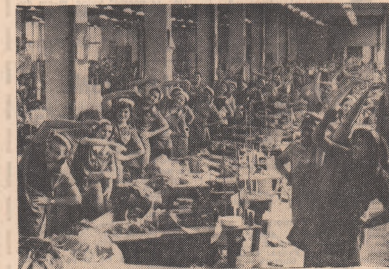
Ora 10 fix. În secția a 15-a a Întreprinderii de confecții și tricotate București se execută programul de gimnastică la locul de muncă.

Asociația sportivă Grivița Roșie, de pe lângă întreprinderea mecanică de material rulant și întreprinderea de utilaj chimic Grivița Roșie, este o unitate sportivă fruntașă, cu nu mai puțin de 5 258 de membri coti-