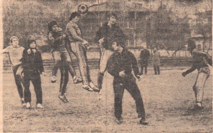
Aspect de la unul din ultimele antrenamente ale echipei bucureștene Progresul.

PROGRESUL BUCUREȘTI: ACUMULĂRILE, CONFORM AȘTEPTĂRILOR. La clubul din str. dr. Staicovici, multă circumspecție la reluarea campionatului. Nu se exagerează greutățile returului dar nici nu se uită că, așa cum ne-a precizat președintele clubului, Constantin Dumitrescu — „lotul Progresului e modest”. „În turneul efectuat peste hotare în această iarnă — ne-a mai spus interlocutorul — acumulările au fost vizibile, apoi curba a scăzut, pentru a crește, conform așteptărilor, la startul campionatului”. Obiectiv actual: întărirea (din mers!) a posturilor deficitare (toate pe partea dreaptă!); fundași și extremă. Obiectivul general în retur: menținerea în prima divizie.