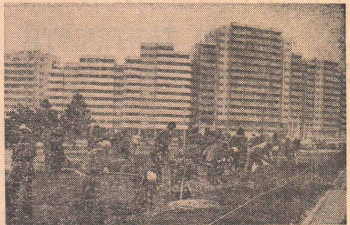
Pe moderna magistrală Colentina grupuri de tineri au lucrat la înfrumusețarea cartierului