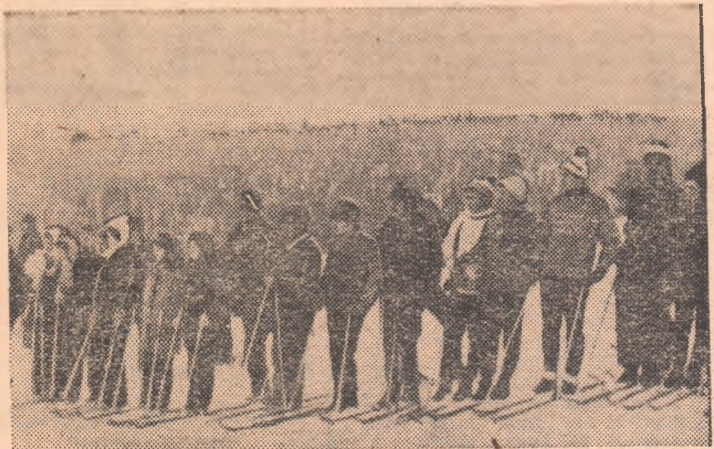
În concursul de la Măgura Calului (județul Bistrița Năsăud ), citeva clipe înainte de darea startului într-o întrecere rezervată tinerilor din mediul rural

Remarcăm și turneul de box, cu caracter județean, la care au participat sportivi de la Voința Satu Mare și Unio Satu Mare , precum și meciul de fotbal F. C. Olimpia — Gloria Bistrița — întâlniri ale căror încasări au fost depuse în „contul omeniei”.