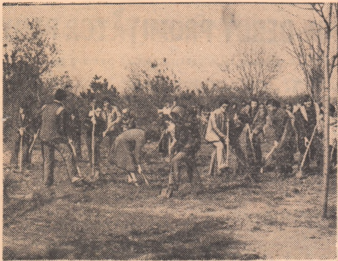
In Parcul Tineretului, studenții Facultății de medicină generală, anul I

Au trecut 16 zile de când Bucureștiul nostru drag a fost afectat grav, de pe urma groaznicului cutremur din seara zilei de 4 martie, zile în care oamenii muncii din Capitală, de pretutindeni din țară, au depus eforturi, o muncă titanică, plină de dăruire, eroism și sacrificiu, pentru înlăturarea gravelor consecințe ale seismului!