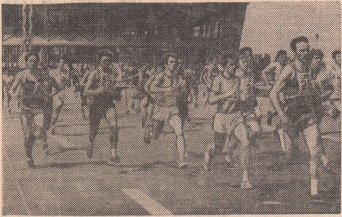
Instantaneu surprins la finala pe țară a „Crosului tineretului“ care s-a desfășurat în 1976, la Complexul expozițional „Casa Școlii“ din Capitală

Duminică 27 martie se va da startul într-o amplă competiție de masă, de mare popularitate, „Crosul tineretului“. În acest an, când se desfășoară cea de a X-a ediție, întrecerea se încadrează în acțiunile care marchează sărbătorirea „Zilei tineretului“ și cea de a 55-a aniversare a creării Uniunii Tineretului Comunist.