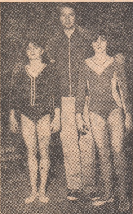
Primele gimnaste ale lotului olimpic român, Nadia Comăneci (dreapta) și Teodora Ungureanu, împreună cu antrenorul lor Bela Karoly

CLUJ-NAPOCA, 24 (prin telefon). — Inscriindu-se în opera de ajutorare a sinistratilor, la Sala sporturilor din Cluj-Napoca a avut loc joi după-amiază un spectacol demonstrativ de gimnastică sportivă și ritmică oferit de lotul olimpic feminin al României, spectacolul la care și-au mai dat concursul sportivi localnici de la C.S.M., Politeh-