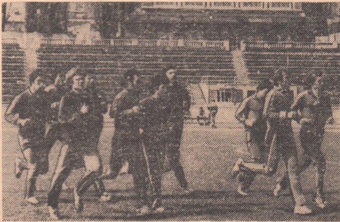
Aspect de la unul din antrenamentele lotului reprezentativ de fotbal

Fiind vorba de o „repetiție generală“, așteptăm din partea echipei noastre o concentrare cît mai puternică asupra meciului, dăruire în joc, astfel