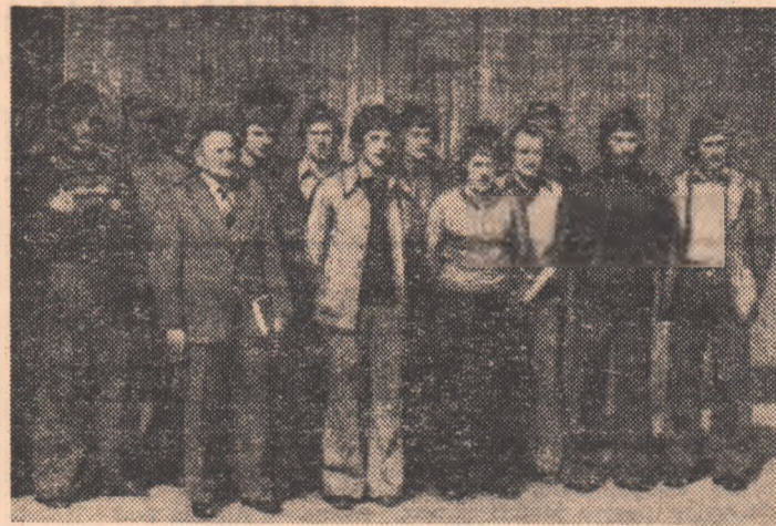
Fotbalistii polonezi surprinși ieri in imagine, in sala hotelului Dorobanți, in momentul in care se pregăteau să plece la antrenamentul de pe stadionul „23 August”