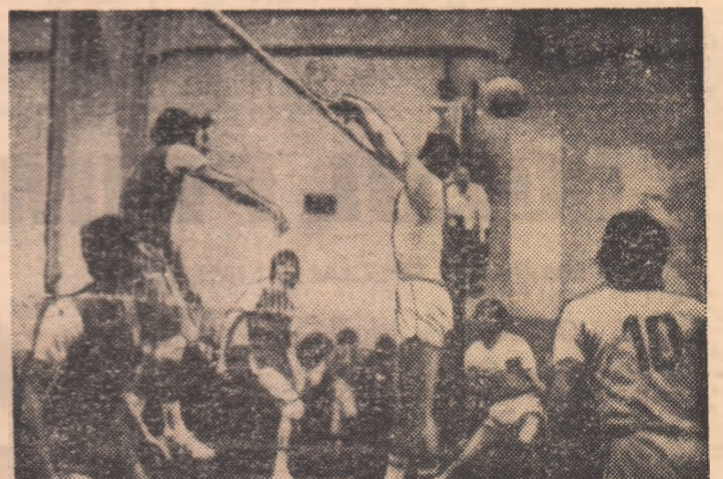
Partida restantă dintre echipele masculine Rapid și Dinamo, de la care vă prezentăm imaginea, realizată de fotoreporterul nostru Vasile Bageac, a fost ultima din sezonul oficial 1976/1977 desfășurată în Capitală.

(Citiți amănunte asupra desfășurării acestei întîlniri în pag. 2—3, la rubrica: Campionate, competiții)